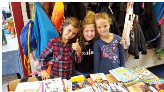
Boekenmarkt op De Zaaier in Hedel

Vorige week werd het logo van de SCOB onthuld. U ziet het bovenaan deze nieuwsbrief. In de 6 vlakken herkennen wij de 6 scholen, de rivier vormt de verbinding. Tegelijkertijd wordt hierin ook het landschap van onze omgeving zichtbaar, platteland omsloten door rivieren. De rivier staat tevens voor beweging, dynamiek, vooruitgang: kenmerken waarvan wij hopen dat zij synoniem zijn voor onze scholen. Het water glinstert, verfrist, en bruist net als onze kinderen die zich nieuwsgierig uitstrekken naar een onbekende toekomst. Tenslotte zien wij in de rivier het beeld van onze God Die als levenwekkend Water in ons hart aanwezig wil zijn.