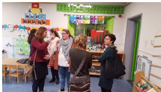
Leerkrachten van groep 1 en 2 in gesprek

Voor de leerkrachten van de scholen worden lunch&learn-bijeenkomsten georganiseerd. Op de woensdagmiddag ontmoeten leerkrachten van een bepaalde groep elkaar en spreken over de specifieke aandachtspunten van hun leerjaar. Na een smakelijke lunch volgt in de regel een geanimeerd gesprek over allerlei aspecten van het leraarsvak. Natuurlijk wordt ieder overleg afgesloten met een kijkje in de klas.