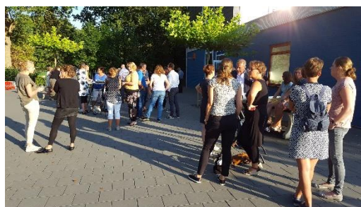
Opening schooljaar in Brakel

Met veel genoegen bieden wij u vandaag onze eerste nieuwsbrief aan. Op 01 augustus 2017 was de Stichting Christelijk Onderwijs Bommelerwaard officieel een feit. Sinds dat moment is er veel gebeurd. In deze nieuwsbrief willen wij u daarover graag informeren.